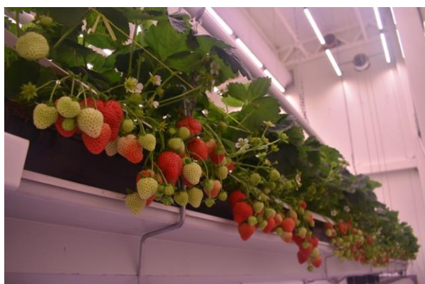
Daglichtloze aardbeienteelt in R&D cellen

Vanaf onze oprichting in 2014 zijn we doorgegroeid naar een team van 25 collega's en een vestiging in de Verenigde Staten in Houston, Texas. De vraag naar duurzame oplossingen voor de voedselproductie blijft stijgen en daarom zijn wij op zoek naar uitbreiding van ons team.