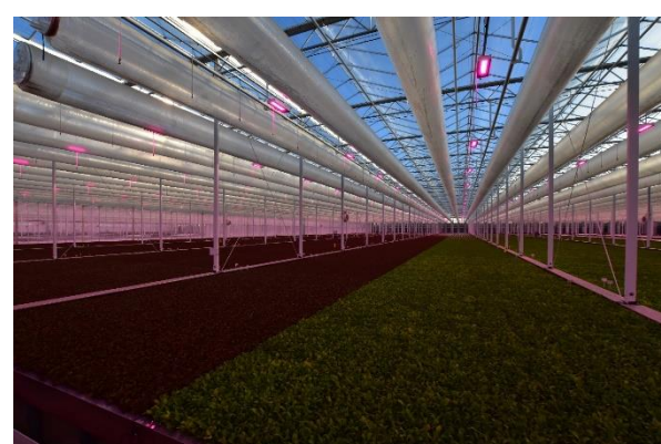
Hydroponische teelt van sla met blauw licht