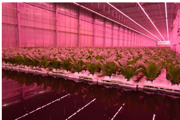
Hydroponische teelt van sla