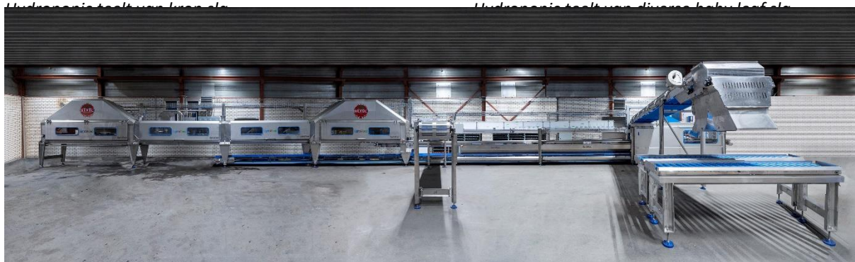
Turn Key machinelijn voor het verwerken van hydroponic geteelde gewassen